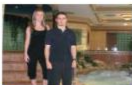
Mauro-Silvia Promoción: 2008 Hotel Spa Riu (Son Oliva)