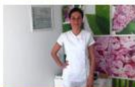
Kata Igrici Promoción: 2015 Quirofort (Palma)